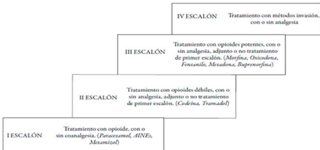
Figura 1- Escala de analgesia para el tratamiento del dolor según la OMS

En caso de no controlar el dolor con el primer escalón de forma pautada, se deberá avisar al servicio de anestesia para pautar un protocolo de tratamiento del dolor adecuado al paciente.