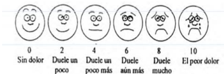
Figura 2- Escala del dolor de caras de Wong y Baker. 3 -7 años colaboradores.

Según la edad del paciente y su capacidad de comunicación se utilizará una escala u otra para la evaluación de la intensidad del dolor.